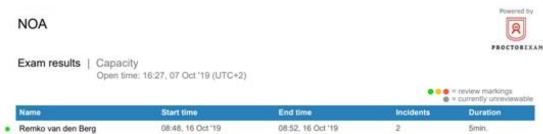
Figuur 1. Managementrapportage voorbeeld