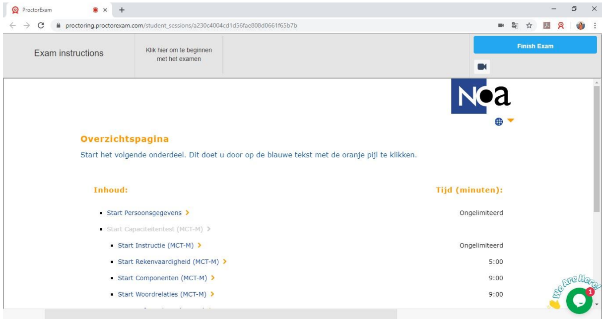
Figuur 4. NOA Online afname binnen proctoring